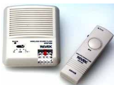
ワイヤレスチャイムの例