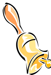
手で持って鳴らせる鈴